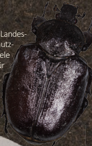
Käfer in Originalgröße